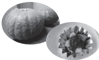
手稲区で採れたかぼちゃ「銀世界」を使って調理 行事食献立「冬至南瓜」