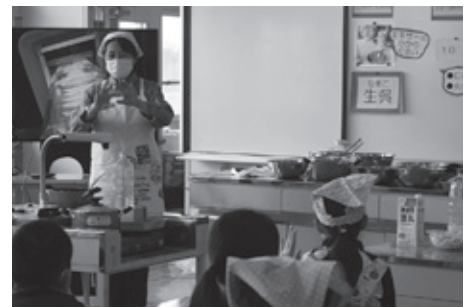
総合的な学習の時間。コロナ禍で工夫しながら「豆腐づくり」