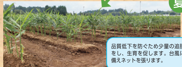
品質低下を防ぐため少量の追肥をし、生育を促します。台風に備えネットを張ります。