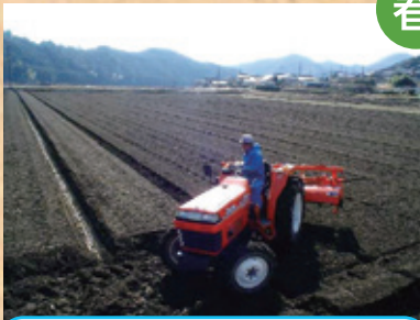
堆肥と肥料を耕運し、土とよく混ぜます。