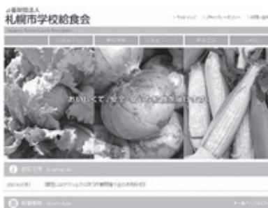
3- (1) 「ホームページ」のアドレスは、 http://www.sapporo-gk.or.jp/ です。