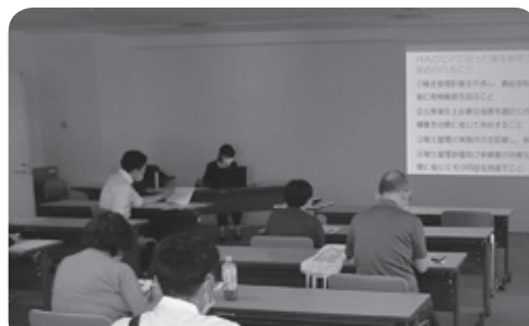
令和2年度の1-(7)「物資別講習会」は、食肉類を取り扱う登録業者を対象として実施しました。