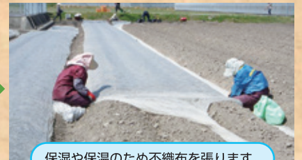
保湿や保温のため不織布を張ります。

収穫後の畑作業こそが次の一年の生姜の出来栄を決める重要な作業となります。水はけの悪い畑は病気も出やすく、生育も悪くなります。水はけをよくするために丹念に専用の機械で水の通りをよくし、そのあと堆肥を畑全体に散布します。