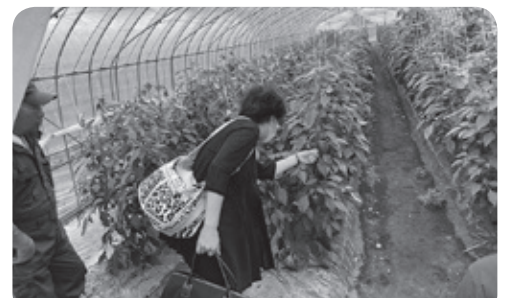
1-(3)の青果物は、職員が圃場を視察し、産地JAや生産者から話を聞くなど十分検討した上で決定します。