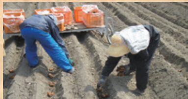
生姜の方向を見極め、熟練者の手作業で植え付けます。覆土の厚さは生姜の形状に影響します。

収穫後の畑作業こそが次の一年の生姜の出来栄を決める重要な作業となります。水はけの悪い畑は病気も出やすく、生育も悪くなります。水はけをよくするために丹念に専用の機械で水の通りをよくし、そのあと堆肥を畑全体に散布します。