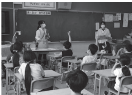
栄養教諭と養護教諭による指導

新型コロナウイルス感染症の影響で、「学校の新しい生活様式」や「教育活動のガイドライン」に従った多くの制約・制限のもとではありますが、子どもたち一人一人が自ら健康や成長を意識した食生活を身に付けていけるよう、コロナ禍における食指導を工夫していきたいと思えます。